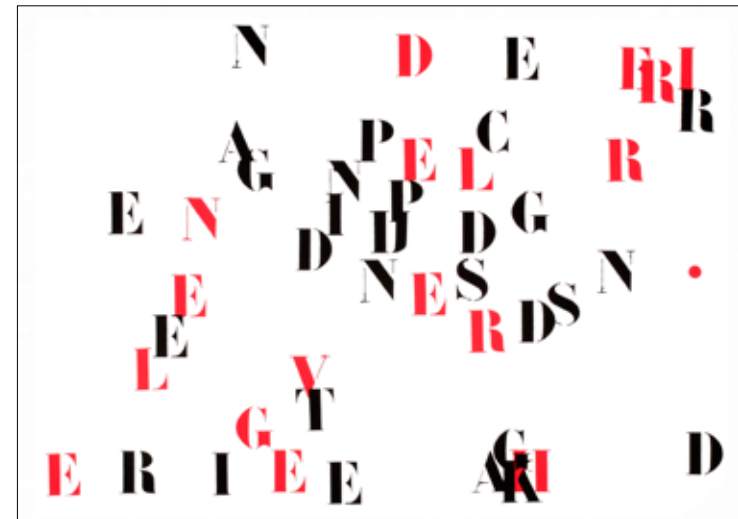
hommage aan de chaoten 1969-1981