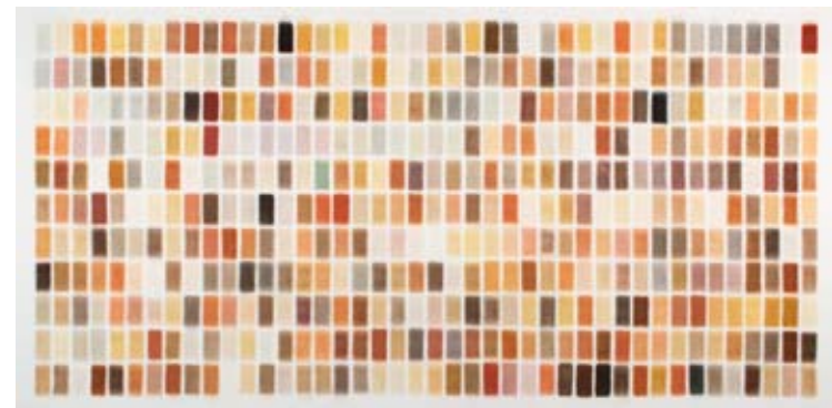
from earth 2007

De sobere random objectivations maken langzaam plaats voor kunstwerken waarin hij objecten uit de natuur laat zien. Hij doet dit met zo min mogelijk ingrepen, door bijvoorbeeld schelpen of bladeren van een bepaalde soort naast elkaar op een papier te bevestigen. Hiermee werkt hij het concept van het letterlijk laten zien van objecten verder uit. Niet alleen laat hij gevonden voorwerpen onveranderd zien, zoals hij in zijn vroege collages al deed, ook benadrukt hij het unieke van elk object door exemplaren van dezelfde soort naast elkaar te leggen. In deze wetenschappelijk aandoende collages valt op dat elk blad en elke stengel eigenaardigheden heeft die het uniek maken. Door op deze manier de aandacht op de uniciteit van elk object te richten, ondergraaft de vries bewust de wetenschappelijke categorisering waarin objecten hun eigenheid verliezen.